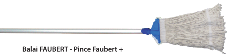
Balai FAUBERT - Pince Faubert + Frange 350g + Manche aluminium 1,40m Réf : 0022005