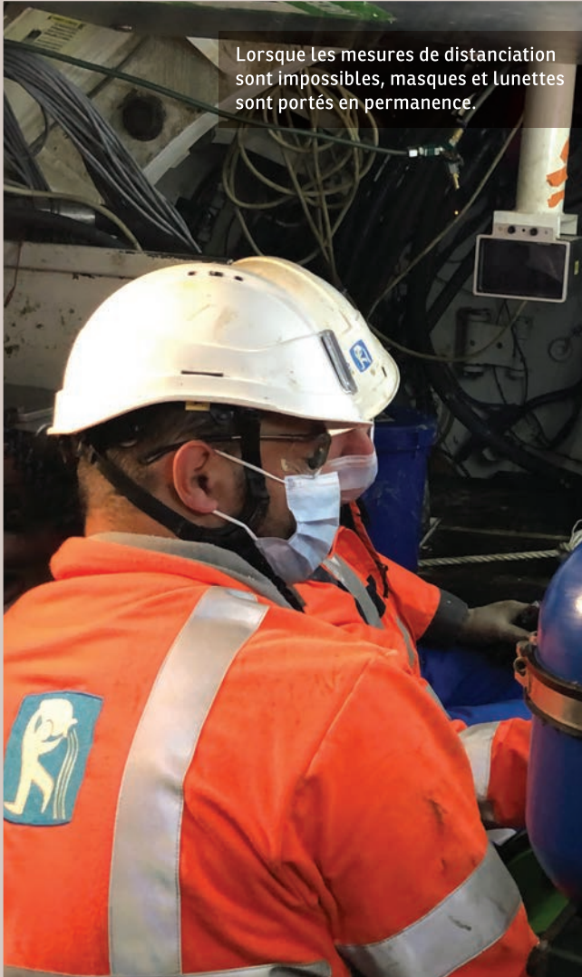
Lorsque les mesures de distanciation sont impossibles, masques et lunettes sont portés en permanence.