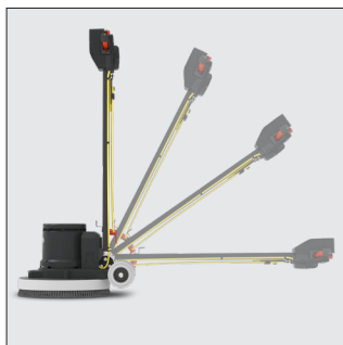
Poignée entièrement réglable