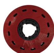
Plateau moteur NuLoc2