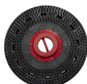
Plateau moteur PadLoc