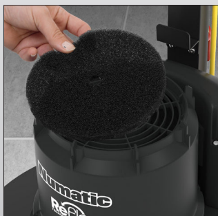
Filtre haute poussière optionnel