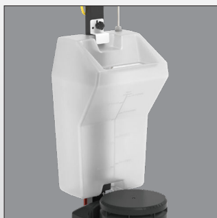
Réservoir de solution optionnel