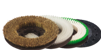
Brosses & pads disponibles