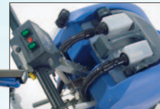
poste de pilotage simplifié