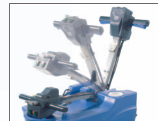
poste de pilotage repliable