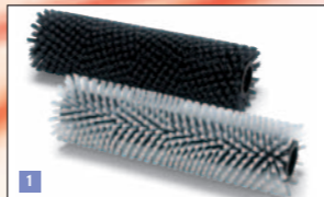
1. Brosses cylindriques nylon et LongLife 350mm

Brosses et plateaux supports-disques pour tous les modèles