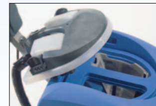
panier récupérateur de déchets