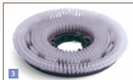
3. Brosses de nettoyage en Nylon