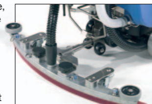
nouvelle embouchure d'aspiration parabolique en aluminium

Disponible en version S (simple bac de récupération des eaux usées) ou T (double bac de récupération des eaux usées), la TWINTEC TT3450 présente une largeur de travail de 45cm qui lui garantit le plus grand rendement de sa catégorie.