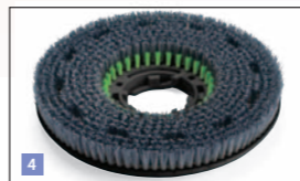
4. Brosses LongLife